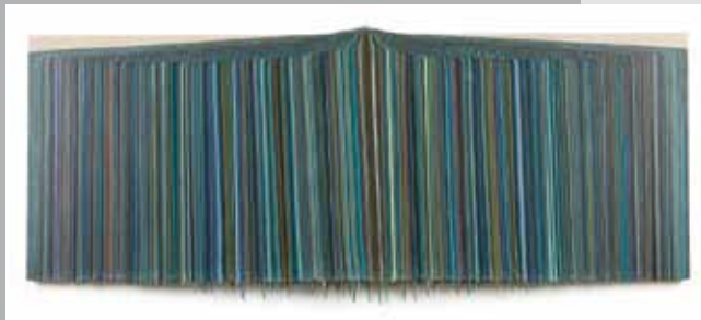
BAS LOBIK (NL)