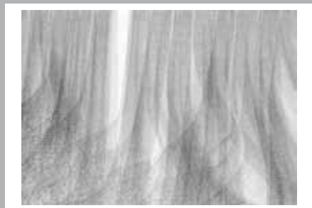
STEPHANIE KRATZ (NL /D)