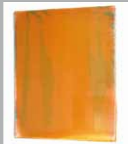
JUS JUCHTMANS (B)